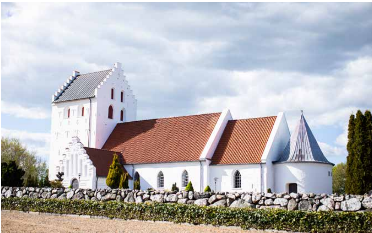
Taulov Kirke er én af de mange hundrede middelalderkirker i det danske landskab.

Og derfor skal der passes godt på den. Det hjælper blandt andet kongelig bygningsinspektør og konsulenterne fra Nationalmuseet med. Oftest finder man en løsning gennem dialog, siger Gunilla Rønnow, der netop er stoppet som kongelig bygningsinspektør i Haderslev Stift.