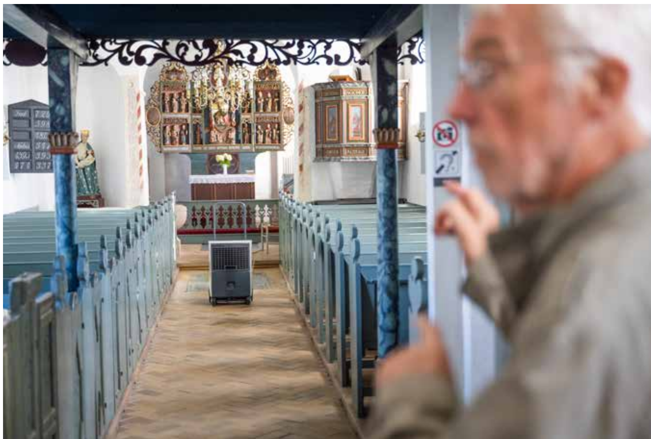
En affugter står nu midt i kirkerummet, og den opsamler vand, som løber ud på kirkegården.

Det begyndte med en bisættelse i november 2022. Gæsterne var ved at finde på plads i den lille Højrup Kirke uden for Arnum. Da en af gæsterne var nået halvejs op ad kirkegulvet, vendte han om, og på vej ud af kirken sagde han til kirketjeneren: "Jeg kan ikke være i jeres kirke. I har skimmelsvamp". Personalet i kirken havde talt om, at luften af gammel kirke var blevet mere voldsom.