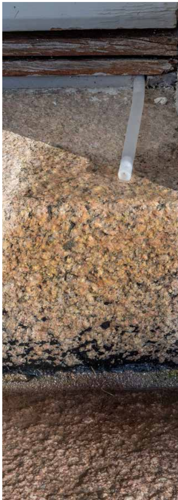
Uden for kirken kan man se, at affugteren virker, for der løber lige så stille vand ud af ledningen fra affugteren.

Efter at der var konstateret skimmelsvamp blev et firma hyret til at se, hvor omfangsrigt skimmelangrebet var. Svaret var, at det var alvorligt, og at det var overalt. Mens undersøgelsen stod på, var kirken lukket i 14 dage, men ellers har den været i brug i hele rengøringsprocessen.