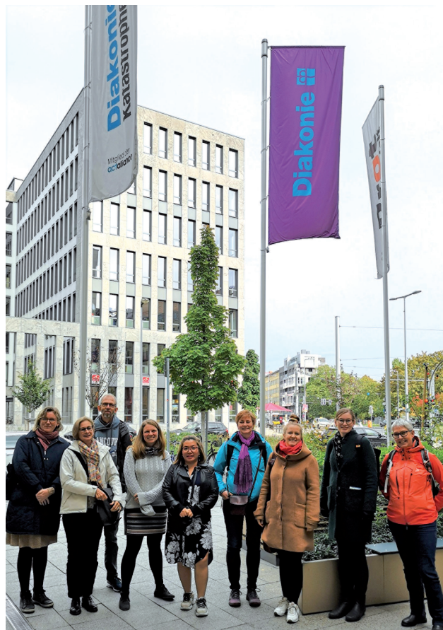
Studieturen til Berlin hvor diakoniudvalget blandt andet fandt inspirationen til #SAMMENienkoldtid

I kampagnematerialet på hjemmesiden kan man se forskellige ideer, som måske kan bruges i ens eget sogn. Hver for sig kan vi gøre lidt, sammen kan vi gøre meget. Link til kampagnemateriale